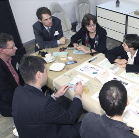
Intensiver Erfahrungsaustausch bei Wissen live!